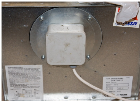
De fire skruene sitter på den runde platen

1. Slå av strømmen på viften ved å koble ut sikringen for Kjøkken.