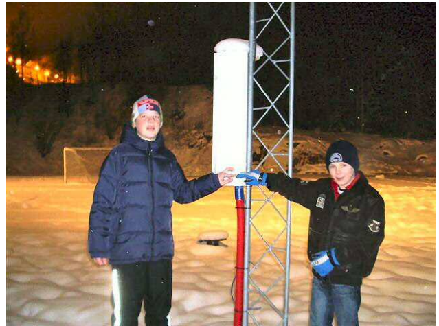
Endelig fikk vi lys på ballbanen